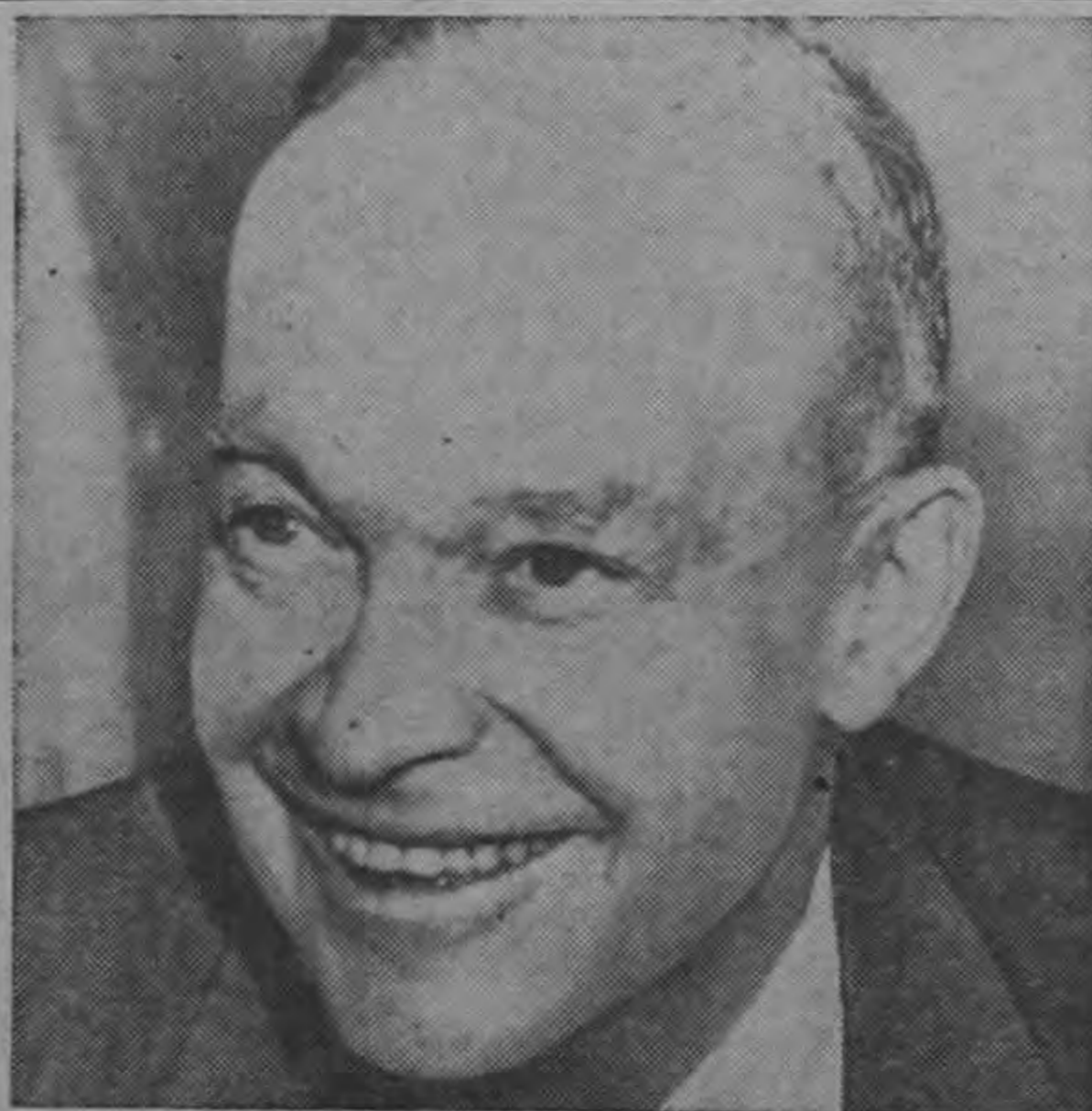
PRESIDENTE DWIGHT EISENHOWER...doctrina Monroe para el Medio Oriente...

En reunión convocada por el Presidente Figueres, a la que asistieron los miembros del Consejo de Gobierno, varios diputados y funcionarios de la Oficina Presupuestal, se estudió la necesidad de efectuar algunas reformas que lo hagan operante, ya que errores de copia y de cálculo hacen inutilizables algunas partidas. Ayer mismo en dependencias de la Asamblea Legislativa se trabajó en la confrontación de esas partidas para localizar los errores apuntados en la reunión a que hacemos referencia. (TEXTO EN PAGINA 4)