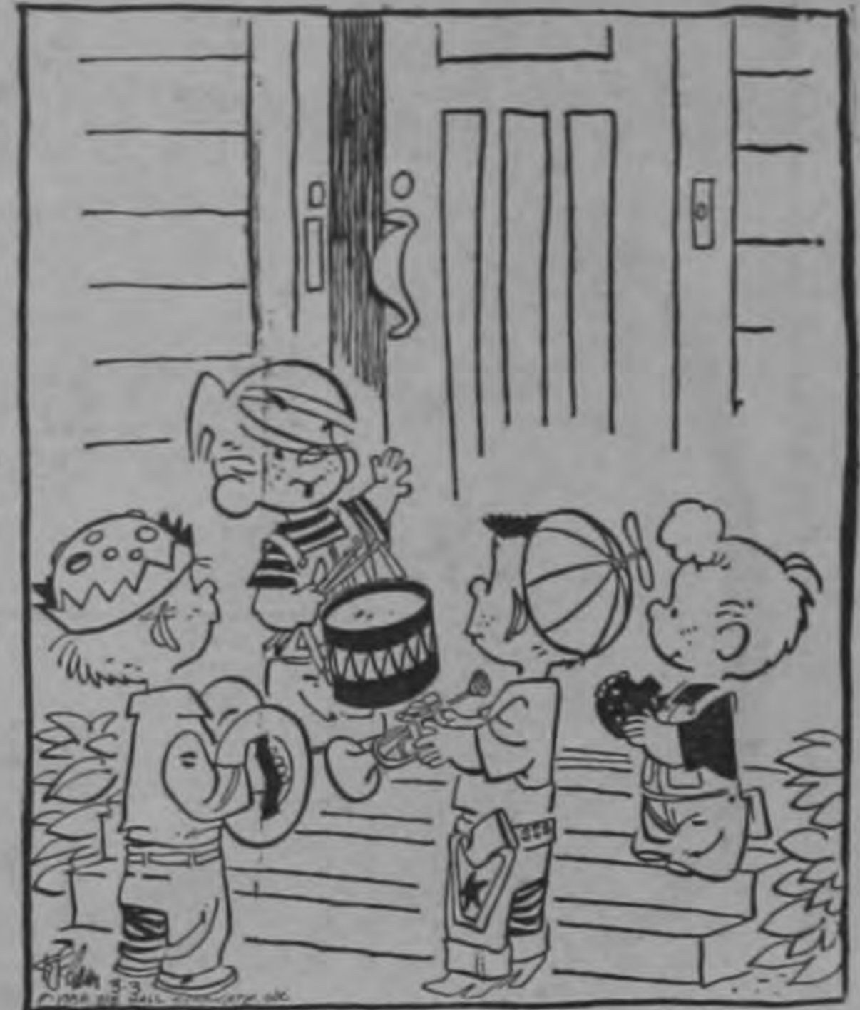
Pasen... pasen... A mis padres les encanta la música...